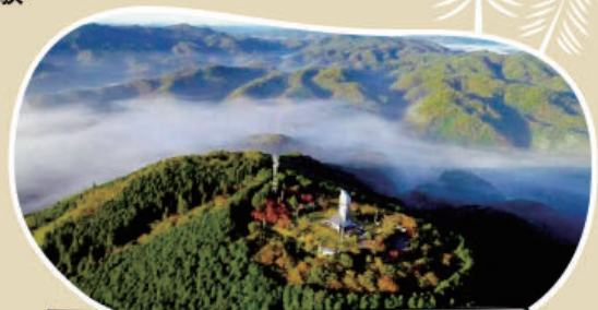
Jinseki kogen-cho MAP