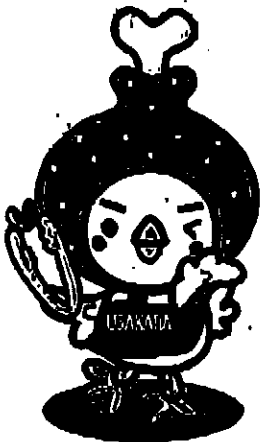
宇佐市観光PRキャラクター うさからくん