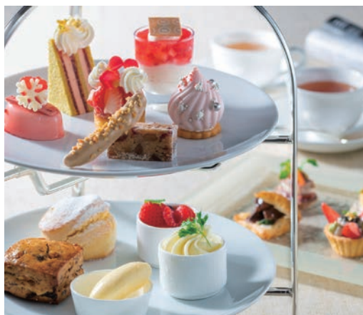
アフタヌーンティー(12月)